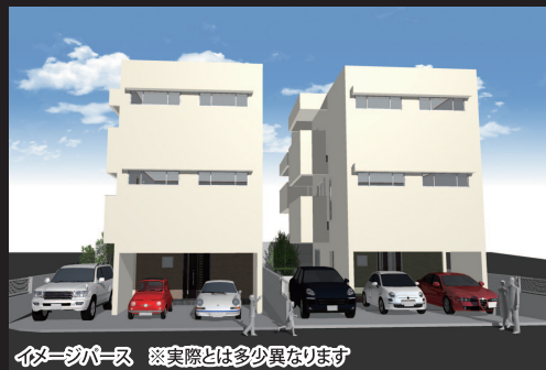
イメージ写真 ※実際とは多少異なります